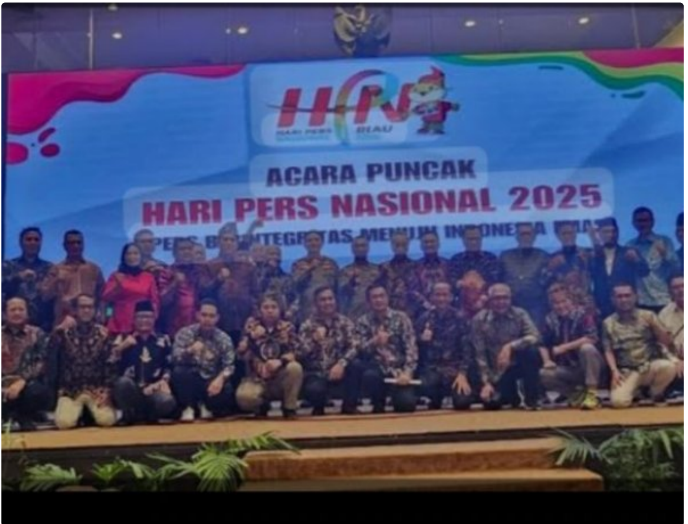
HPN 2025: Pers Berintegritas Menuju Indonesia Emas di Tengah Tantangan Zaman

Pekanbaru, Riau – Puncak peringatan Hari Pers Nasional (HPN) 2025 berlangsung meriah di Grand Ballroom Mutiara Merdeka, Kota Pekanbaru, Riau, pada Minggu, 9 Februari 2025. Mengusung tema "Pers Berintegritas Menuju Indonesia Emas," perayaan tahun ini diwarnai dengan refleksi mendalam atas kondisi pers nasional dan dinamika internal organisasi wartawan.